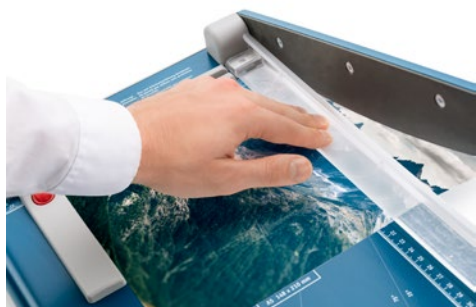
Cizalla Dahle 533 - Prensado manual con protección de dedos integrada para fijar el material a cortar sin riesgos