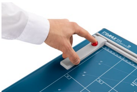
Cizalla Dahle 533 - Tope trasero regulable para facilitar el ajuste del formato